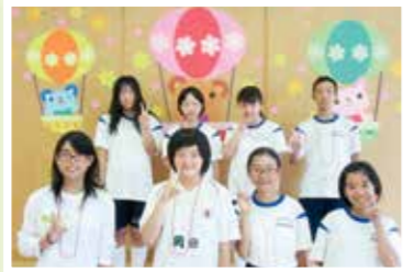
市立鴨島東・鴨島第一・川島中学校から参加してくれました。3日間お疲れ様でした。