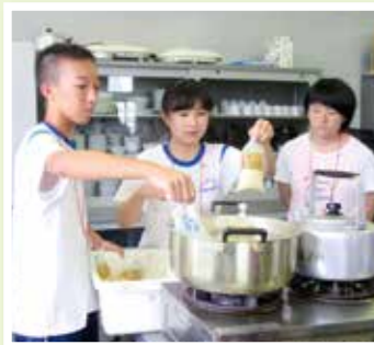
ゆでる水は川や池の水でも大丈夫、水が貴重となる災害時に最適です。

災害時の炊き出しの際にご飯やおかゆを準備するための炊飯袋のことです。袋にお米とお水を入れて、袋ごとお湯の中で約30分間ゆでれば誰でも失敗なく炊くことができます。おかゆや雑炊、野菜や具を入れた炊き込みご飯、味付けご飯等を好みに合わせて作ることができます。今回作ったのは「簡単&激うま！ケチャップライス」でした。