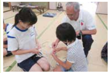
しばしロープと格闘中。通し方がなかなか複雑です。覚えておけるかな？

市内の中学生のみなさん、ボランティアに興味がある方は、来年も是非参加してください。